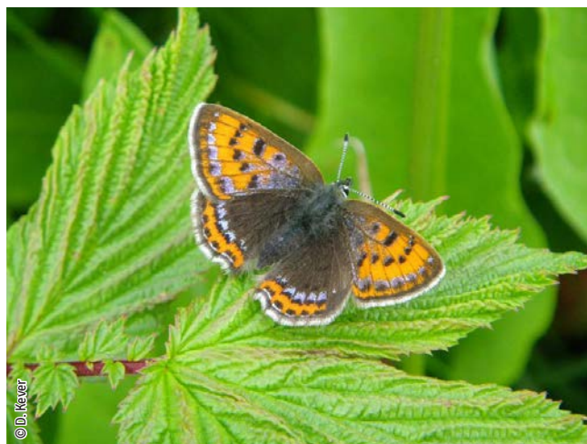
Cuivré de la bistorte

Une espèce Natura 2000 est une espèce en danger d'extinction, vulnérable, rare ou dont la répartition géographique est restreinte à l'échelle européenne. La liste des principales espèces Natura 2000 présentes dans ce site sont :