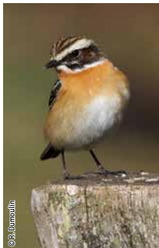
Tartier des prés