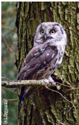
Chouette de Tengmalm