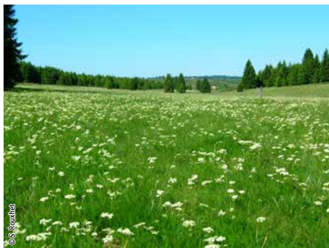
Prairie de fauche de montagne

Un habitat Natura 2000 est un milieu rare, menacé ou remarquable à l'échelle européenne. En Wallonie, ces habitats sont regroupés en unités de gestion (UG) nécessitant des mesures 1 pour les maintenir dans un état de conservation favorable. La liste des principaux habitats Natura 2000 présents dans ce site sont: