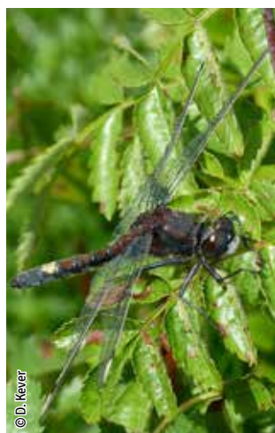
Leucorrhine à gros thorax

Une espèce Natura 2000 est une espèce en danger d'extinction, vulnérable, rare ou dont la répartition géographique est restreinte à l'échelle européenne. La liste des principales espèces Natura 2000 présentes dans ce site sont: