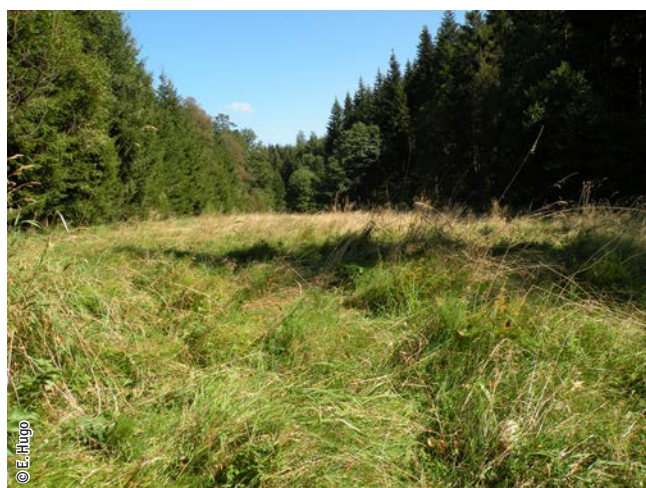
Prairie humide à végétation haute

Un habitat Natura 2000 est un milieu rare, menacé ou remarquable à l'échelle européenne. En Wallonie, ces habitats sont regroupés en unités de gestion (UG) nécessitant des mesures 1 pour les maintenir dans un état de conservation favorable. La liste des principaux habitats Natura 2000 présents dans ce site sont :