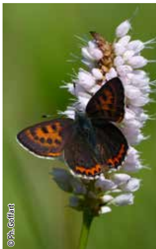
Cuivré de la bistorte