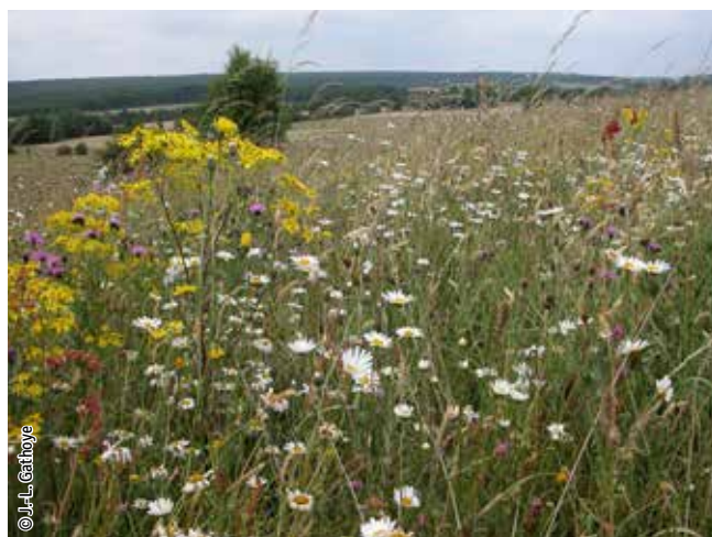
Prairie de fauche de moyenne altitude

Un habitat Natura 2000 est un milieu rare, menacé ou remarquable à l'échelle européenne. En Wallonie, ces habitats sont regroupés en unités de gestion (UG) nécessitant des mesures 1 pour les maintenir dans un état de conservation favorable. La liste des principaux habitats Natura 2000 présents dans ce site sont: