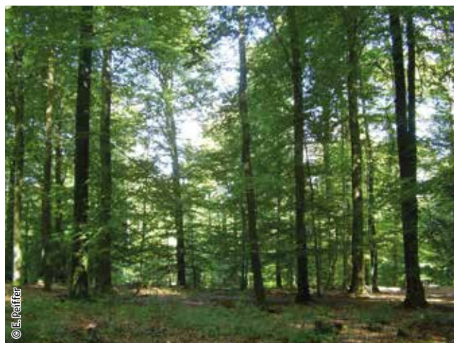
Hêtraie à luzule

Un habitat Natura 2000 est un milieu rare, menacé ou remarquable à l'échelle européenne. En Wallonie, ces habitats sont regroupés en unités de gestion (UG) nécessitant des mesures 1 pour les maintenir dans un état de conservation favorable. La liste des principaux habitats Natura 2000 présents dans ce site sont: