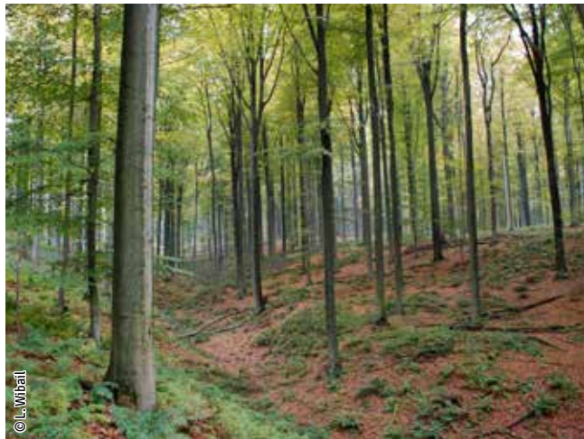
Hêtre à luzule

Un habitat Natura 2000 est un milieu rare, menacé ou remarquable à l'échelle européenne. En Wallonie, ces habitats sont regroupés en unités de gestion (UG) nécessitant des mesures 1 pour les maintenir dans un état de conservation favorable. La liste des principaux habitats Natura 2000 présents dans ce site sont: