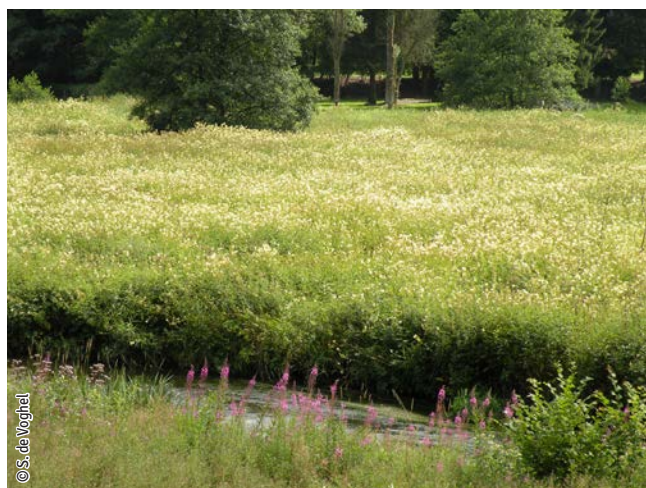
Mégaphorbiaie (prairie humide à végétation haute)

Un habitat Natura 2000 est un milieu rare, menacé ou remarquable à l'échelle européenne. En Wallonie, ces habitats sont regroupés en unités de gestion (UG) nécessitant des mesures 1 pour les maintenir dans un état de conservation favorable. La liste des principaux habitats Natura 2000 présents dans ce site sont :