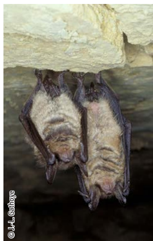
Vespertilion à oreilles échancrées

Une espèce Natura 2000 est une espèce en danger d'extinction, vulnérable, rare ou dont la répartition géographique est restreinte à l'échelle européenne. La liste des principales espèces Natura 2000 présentes dans ce site sont :