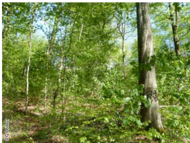
Hêtraie à asperule

Un habitat Natura 2000 est un milieu rare, menacé ou remarquable à l'échelle européenne. En Wallonie, ces habitats sont regroupés en unités de gestion (UG) nécessitant des mesures 1 pour les maintenir dans un état de conservation favorable. La liste des principaux habitats Natura 2000 présents dans ce site sont: