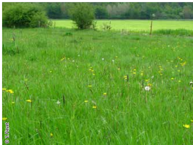
Prairie humide à molinie

Un habitat Natura 2000 est un milieu rare, menacé ou remarquable à l'échelle européenne. En Wallonie, ces habitats sont regroupés en unités de gestion (UG) nécessitant des mesures 1 pour les maintenir dans un état de conservation favorable. La liste des principaux habitats Natura 2000 présents dans ce site sont :