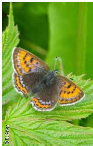
Cuivré de la bistorte

Une espèce Natura 2000 est une espèce en danger d'extinction, vulnérable, rare ou dont la répartition géographique est restreinte à l'échelle européenne. La liste des principales espèces Natura 2000 présentes dans ce site sont :