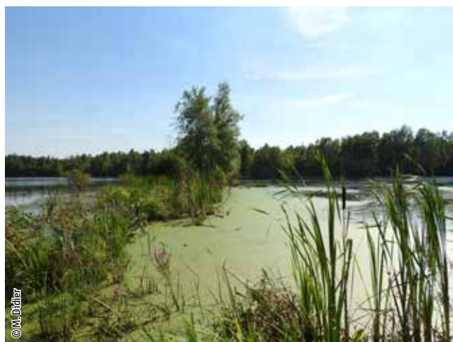
Végétation des plans d'eau riche en éléments nutritifs

Un habitat Natura 2000 est un milieu rare, menacé ou remarquable à l'échelle européenne. En Wallonie, ces habitats sont regroupés en unités de gestion (UG) nécessitant des mesures 1 pour les maintenir dans un état de conservation favorable. La liste des principaux habitats Natura 2000 présents dans ce site sont: