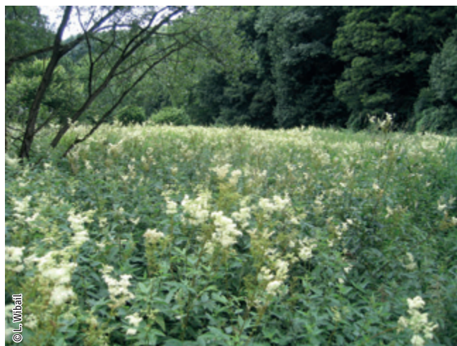
Prairie humide à végétation haute

Un habitat Natura 2000 est un milieu rare, menacé ou remarquable à l'échelle européenne. En Wallonie, ces habitats sont regroupés en unités de gestion (UG) nécessitant des mesures 1 pour les maintenir dans un état de conservation favorable. La liste des principaux habitats Natura 2000 présents dans ce site sont :