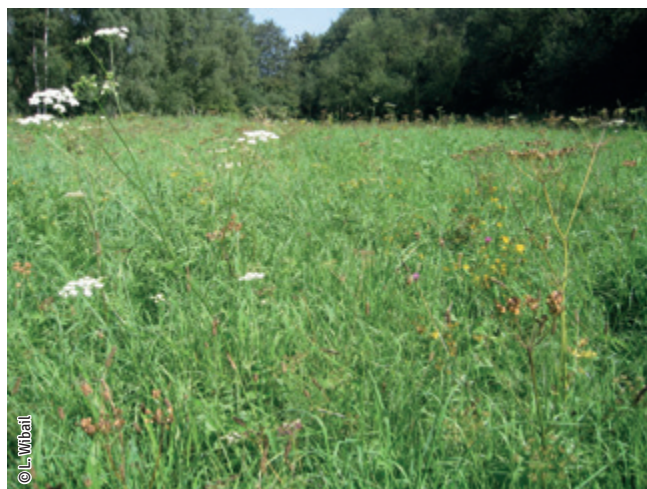
Prairie de fauche

Un habitat Natura 2000 est un milieu rare, menacé ou remarquable à l'échelle européenne. En Wallonie, ces habitats sont regroupés en unités de gestion (UG) nécessitant des mesures 1 pour les maintenir dans un état de conservation favorable. La liste des principaux habitats Natura 2000 présents dans ce site sont :