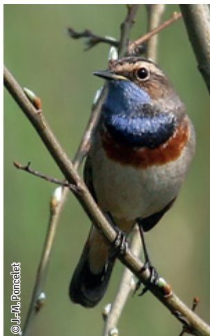
Gorgebleue à miroir