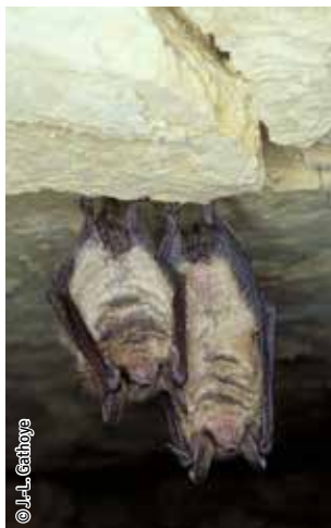
Vespertilion à oreilles échanquées