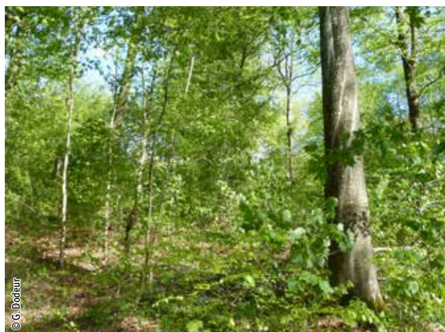
Hêtraie à aspérule

Un habitat Natura 2000 est un milieu rare, menacé ou remarquable à l'échelle européenne. En Wallonie, ces habitats sont regroupés en unités de gestion (UG) nécessitant des mesures 1 pour les maintenir dans un état de conservation favorable. La liste des principaux habitats Natura 2000 présents dans ce site sont: