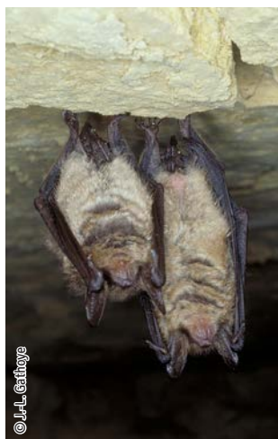
Vespertilion à oreilles échancrées