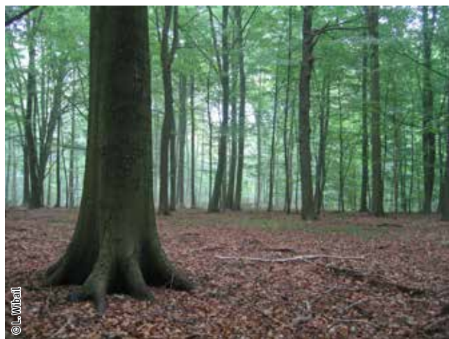
Hêtraie à luzule

Un habitat Natura 2000 est un milieu rare, menacé ou remarquable à l'échelle européenne. En Wallonie, ces habitats sont regroupés en unités de gestion (UG) nécessitant des mesures 1 pour les maintenir dans un état de conservation favorable. La liste des principaux habitats Natura 2000 présents dans ce site sont: