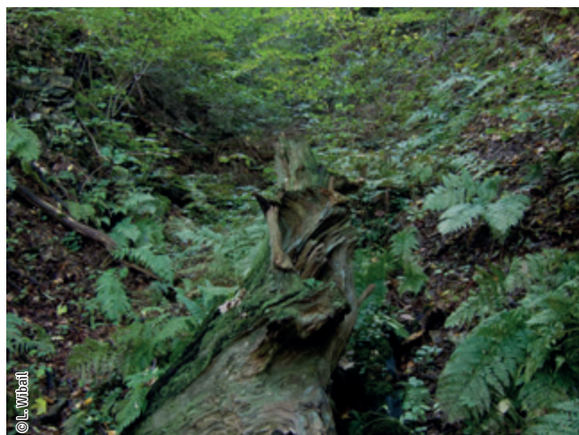
Forêt de ravin

Un habitat Natura 2000 est un milieu rare, menacé ou remarquable à l'échelle européenne. En Wallonie, ces habitats sont regroupés en unités de gestion (UG) nécessitant des mesures 1 pour les maintenir dans un état de conservation favorable. La liste des principaux habitats Natura 2000 présents dans ce site sont :