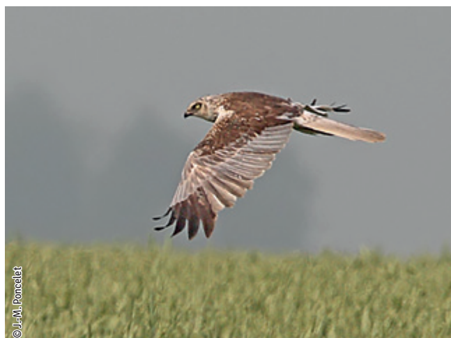
Busard des roseaux

Une espèce Natura 2000 est une espèce en danger d'extinction, vulnérable, rare ou dont la répartition géographique est restreinte à l'échelle européenne. La liste des principales espèces Natura 2000 présentes dans ce site sont :