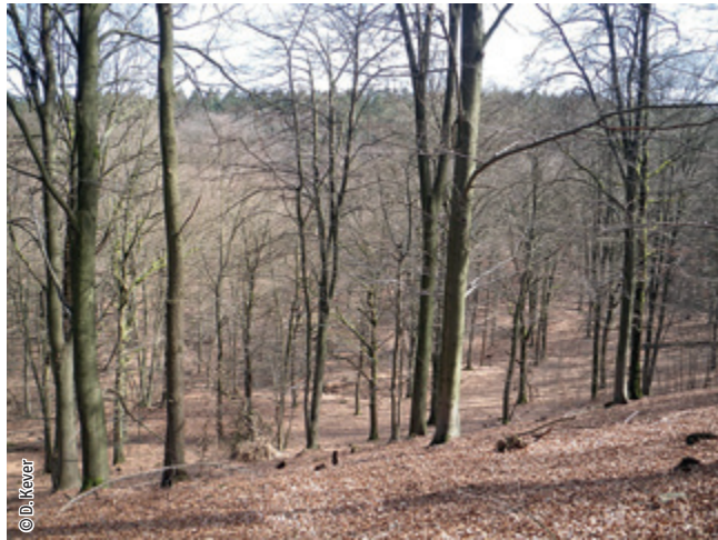
Hêtraie à luzule

Un habitat Natura 2000 est un milieu rare, menacé ou remarquable à l'échelle européenne. En Wallonie, ces habitats sont regroupés en unités de gestion (UG) nécessitant des mesures 1 pour les maintenir dans un état de conservation favorable. La liste des principaux habitats Natura 2000 présents dans ce site sont :