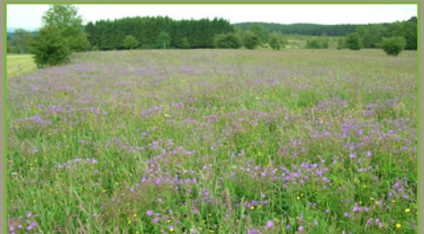
Prairie de fauche montagnarde (> 500 m d'altitude) à géranium des bois