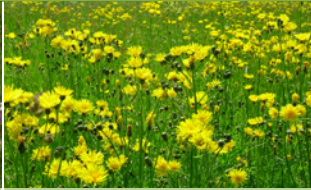
Crépis des prés