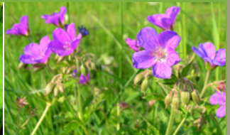
Géranium des bois