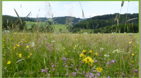
Prairie de fauche collinéenne (entre 300 et 500 m d'altitude)