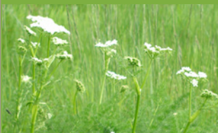
Fenouil des Alpes