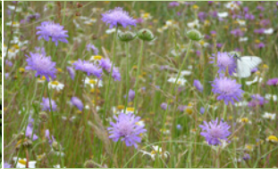
Knautie des champs