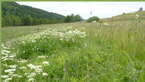
Prairie de fauche montagnarde (> 500 m d'altitude) à fenouil des Alpes