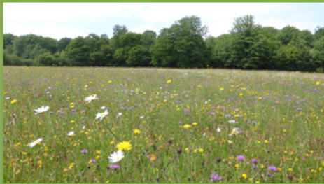
Prairie de fauche des plaines à fromental et crépis des prés (< 300 m d'altitude)