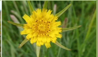
Salsifis des prés